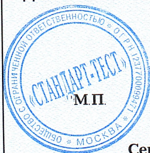
Схема сертификации: 1с.